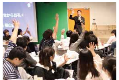
立憲民主党のイベントの様子